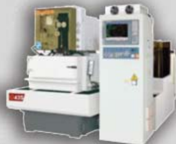
Cortadoras por hilo (Latón)