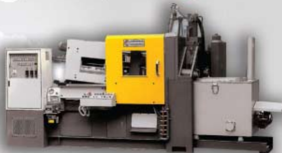
inyectoras de no ferrosos (para Zamac y para aluminio)