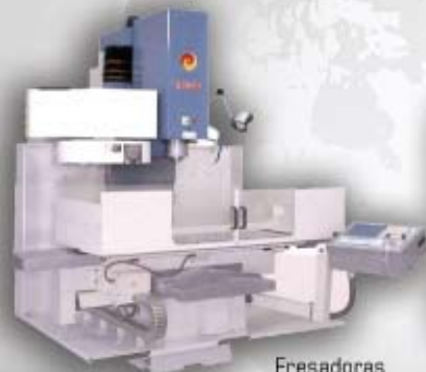
Fresadoras de bancada CNC