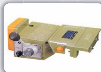
Avance de mesa