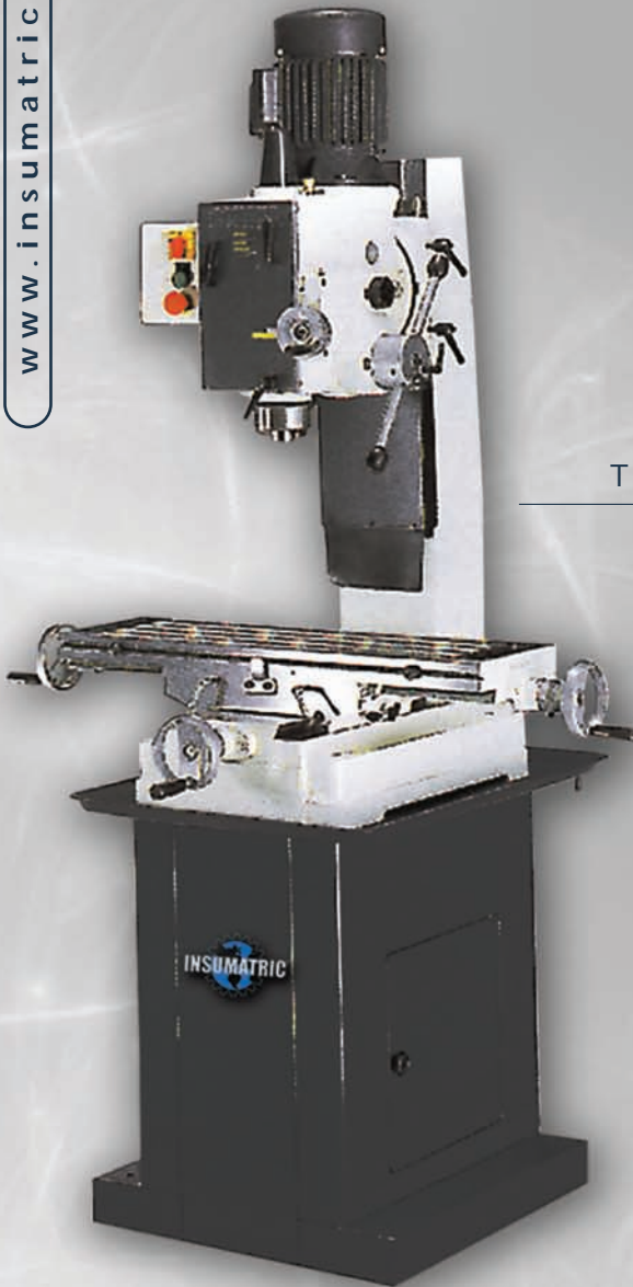
Transmisión a engranajes