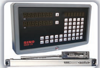
Equipo de lectura digital