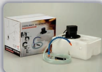
Bomba de refrigeración