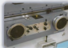
Comando de los avances automáticos de mesa.