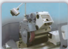
Cabezal de rectificado exterior e interior.