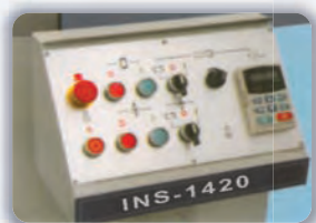
Panel de control.