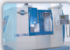
Máquina con cerramiento completo (opcional)