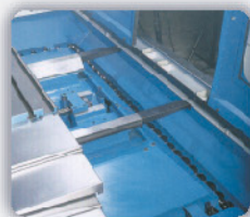
Extractor de viruta por tornillo (opcional)