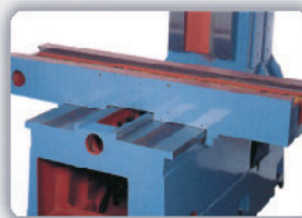
Estructura de máquina.