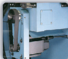
Sistema de movimiento de carro a través de correas.