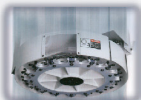
Cambiador de Herramientas.