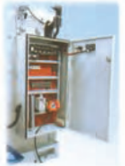
Tablero eléctrico completo con llave de seguridad.