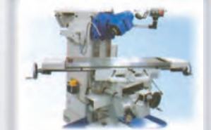
Mesa con giro de 45° sobre carro transversal.