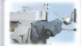
Cabezal Vertical con inclinación lateral .