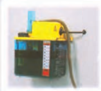
Sistema de lubricación.