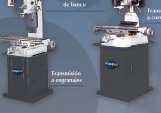
Transmisión a engranajes