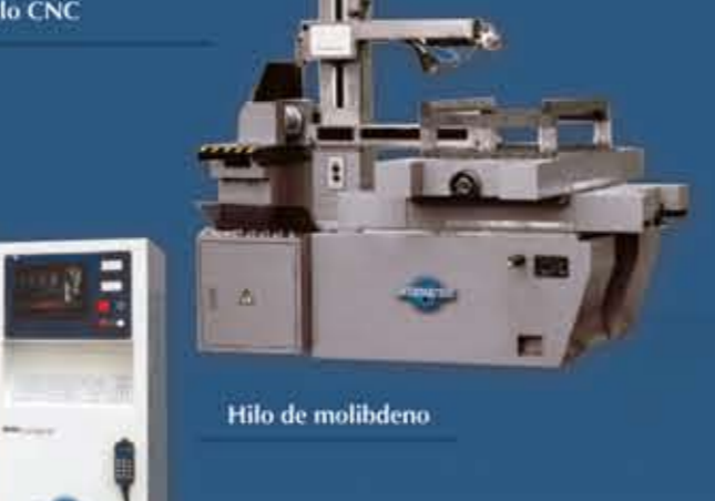
Hilo de molibdeno