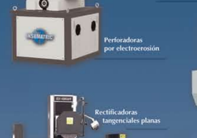
Perforadoras por electroerosión