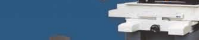
Hilo de molibdeno