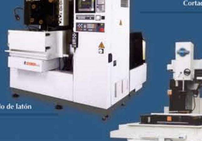
Hilo de latón