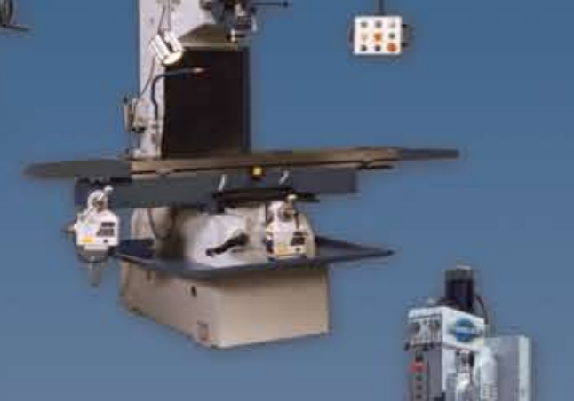
Agujereadoras de columna