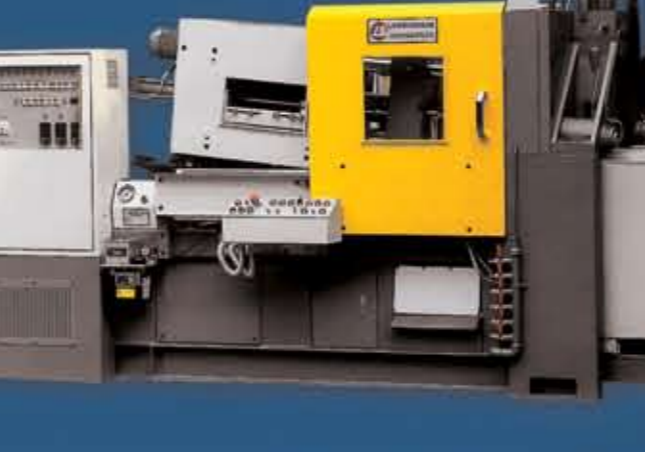
Inyectoras cámara fría (ALUMINIO)