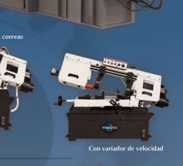
Sierras sin fin