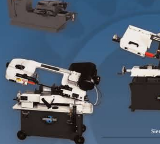
Sierras sin fin